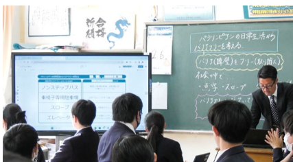
↑各グループが考えたことを、全体で共有している例。さらに考えを深めることができます。

グループでの話し合いなどでは、ICTを活用することで、考えを可視化し、効果的に深めることができます。